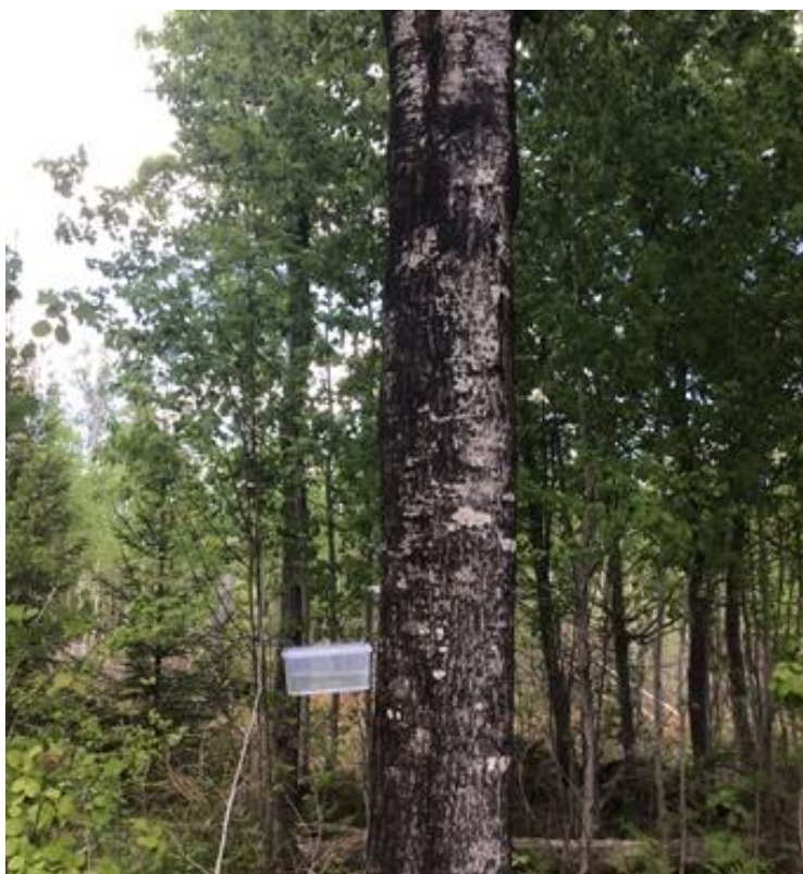
Figur 2. Fönsterfälla 3 på asp med en smärre stamskada. Här noterades senare den regionalt mycket sällsynta griffelblomflugan Ceriana conopsoides NT i fällan.

Vid besöket den 3 juni 2021, sattes alla tio fönsterfällor ut. Fönsterfällorna var av olika modeller men alla följde principen en plexiglasskiva ovanför en vätskefylld behållare på både stående (Figur 2) och liggande substrat (Figur 3).