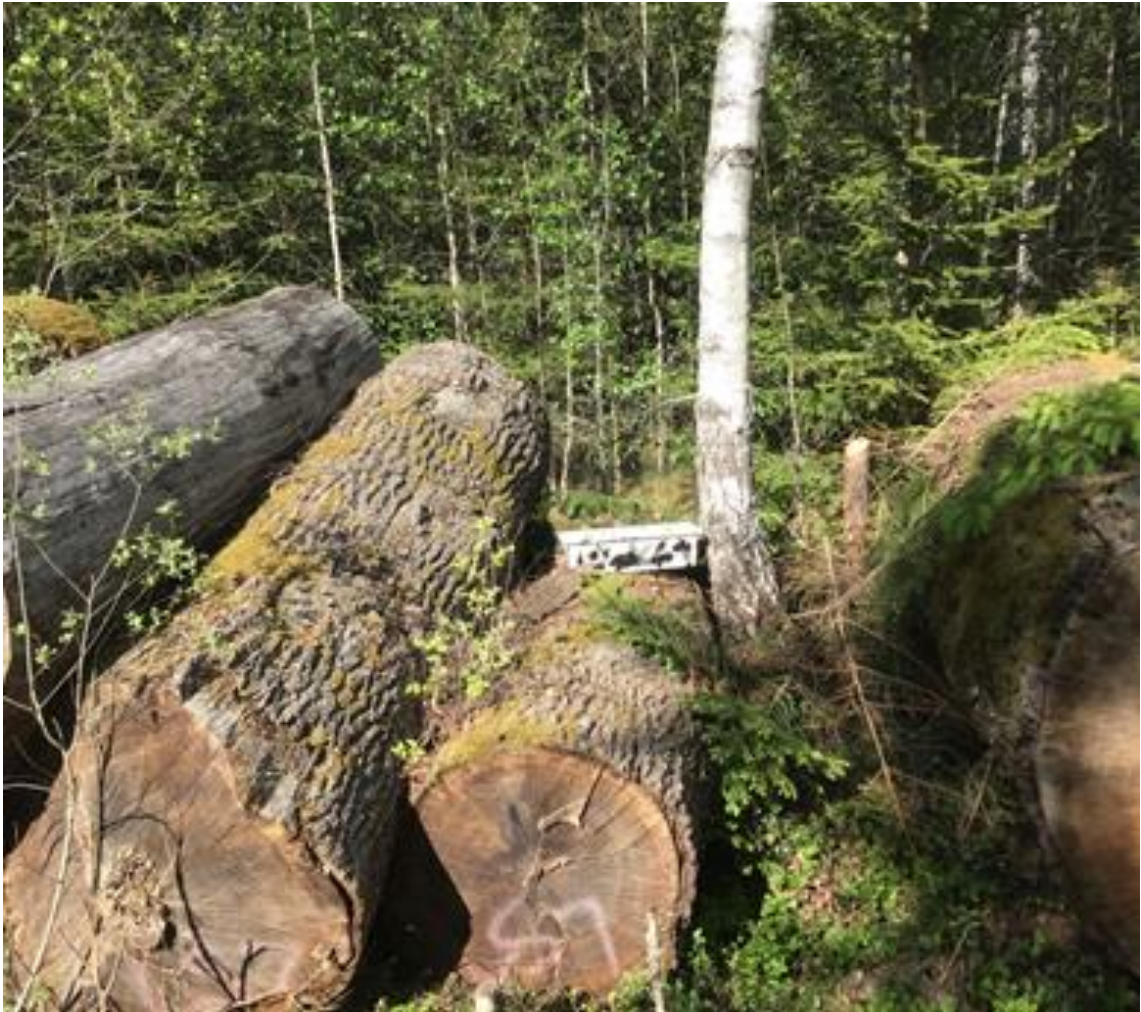
Figur 3. Fönsterfälla på grova, utlagda ekstockar. Här noterades flest rödlistade arter i inventeringen.

Alla fönsterfällor placerades på eller intill död ved men även på träd med skador (figur 2). Fångstvätskan under plexiglasskivan består av 60% vatten, 25% propylenglykol 15% rödsprit plus några droppar med diskmedel. Diskmedlet är till för att minska ytspänningen. Propylenglykol som är giftfri har en konserverande egenskap och rödsprit är både konserverande och har bitterämnen. Med denna typ av vätskan behöver fällorna endast tömmas var fjärde – femte vecka. Fällorna klarade sig överlag bra.